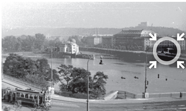
Rok 1955 / výstavba Pavilonku – nekvalitní výřez z dobové pohlednice

V sousedství Ministerstva dopravy ČR, v západním předpolí jeho budovy postavené v letech 1927–1932 podle návrhu arch. Antonína Engela, v trojúhelníku ulic Lodní mlýny, Holbova a nábřeží Ludvíka Svobody, je dnes nenápadný kopeček porostlý křovinami. V těchto místech, kde nyní v letních měsících přespávají bezdomovci, lze ještě dnes nalézt betonové reliktů objektu postaveného v druhé polovině minulého století. Pamětníci si pamatují, že v letech 1955–1956 zde byl postaven objekt, kterému se říkalo „Pavilonek“. Jednalo se o otevřenou letní kavárnu částečně krytou pergolou, na jižní straně s přízemní budovou. V červenci roku 1956 proběhla tiskem zpráva, že byla otevřena v pavilonek na Nábřeží Kyjevské brigády první kavárna, kde se prodávají jen nealkoholické nápoje. Na otevřenou