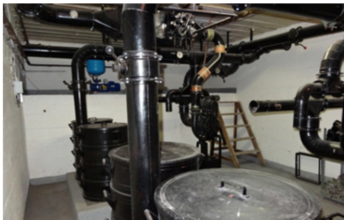
Strojovna krytu pro rozvod kyslíku (stav z roku 2015)

vání Těšnovského tunelu, kterému se říkalo „Husákovo ticho“. Budovu i protiatomový kryt získalo v roce 1990 Ministerstvo dopravy zpět. Kryt byl poničen povodní v roce 2002. Po následných opravách byl v posledních letech dvakrát zpřístupněn veřejnosti v rámci ministerských dnů „Otevřených dveří“. V současnosti Ministerstvo dopravy uvažuje o jeho proměnu na historickou expozici.