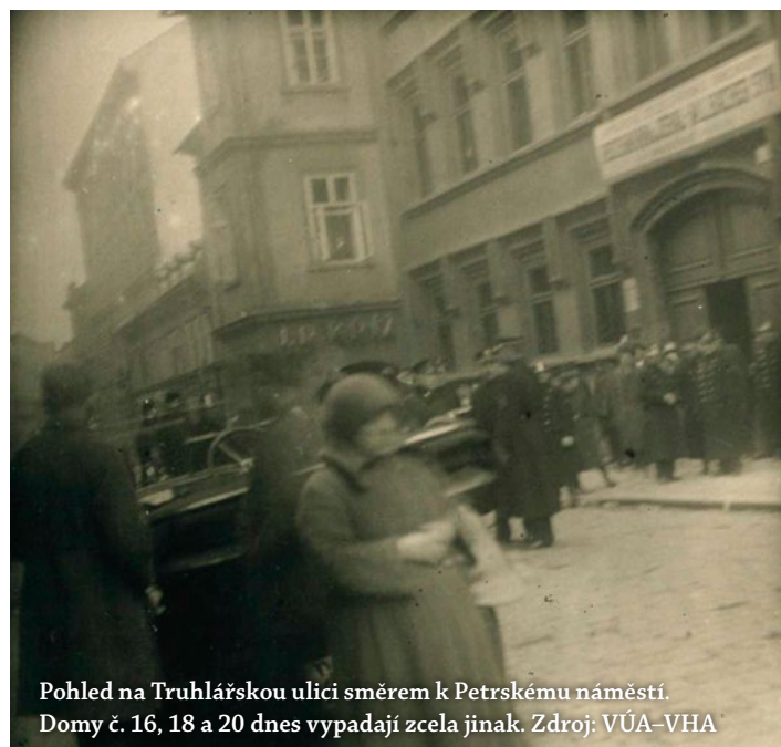
Pohled na Truhlářskou ulici směrem k Petřskému náměstí. Domy č. 16, 18 a 20 dnes vypadají zcela jinak.

Pražští zastupitelé si přáli, aby se vojenské objekty přesunuly mimo město, ale jejich záměr nemohla armáda při nejlepší vůli z finančních důvodů splnit. Kasárna Jiřího z Poděbrad na náměstí Republiky sloužila svému účelu až do roku 1993.