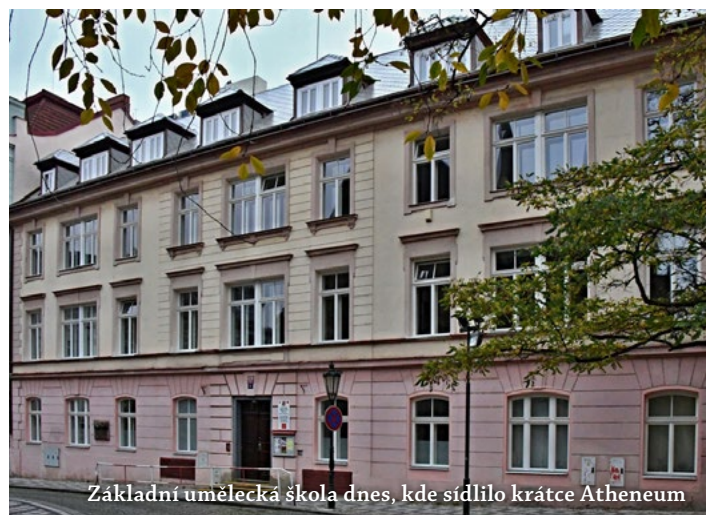
Základní umělecká škola dnes, kde sídlilo krátce Atheneum