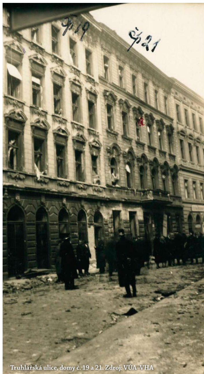
Truhlářská ulice, domy č. 19 a 21.

kův podnik. Ten ještě nějakou dobu armádě zbraně dodával, postupně se však ve druhé polovině 20. let i z dalších důvodů orientoval více na jinou než zbrojní výrobu. Později se firmě začalo dařit jako výrobci motocyklů a automobilů pod značkou JAWA. Františku Janečkovi jako podnikateli věnovala Česká televize první díl seriálu Otcové průmyslu. Výbuchu v Truhlářské ulici věnovala Česká televize také jeden díl ze seriálu Osudové okamžiky. Oba pořady obsahují filmové záběry místa exploze z Národního filmového archivu a lze je shlédnout na iVysílání České televize na internetu.