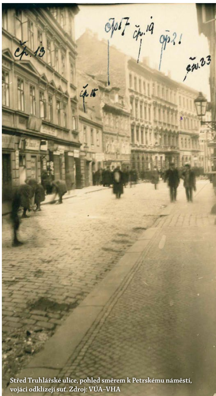
Střed Truhlářské ulice, pohled směrem k Petřskému náměstí, vojáci odklízejí suť.