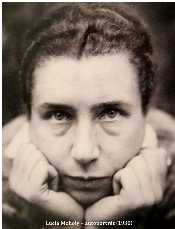
Lucia Moholy – autoportrét (1930)

časopisy v Československu ( Pesný týden , Eva a Český svět ).