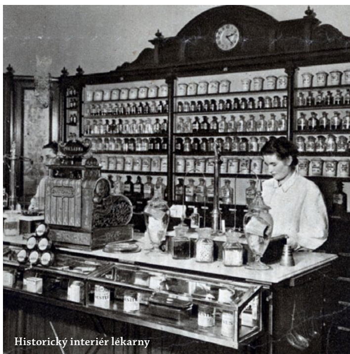
Historický interiér lékárny