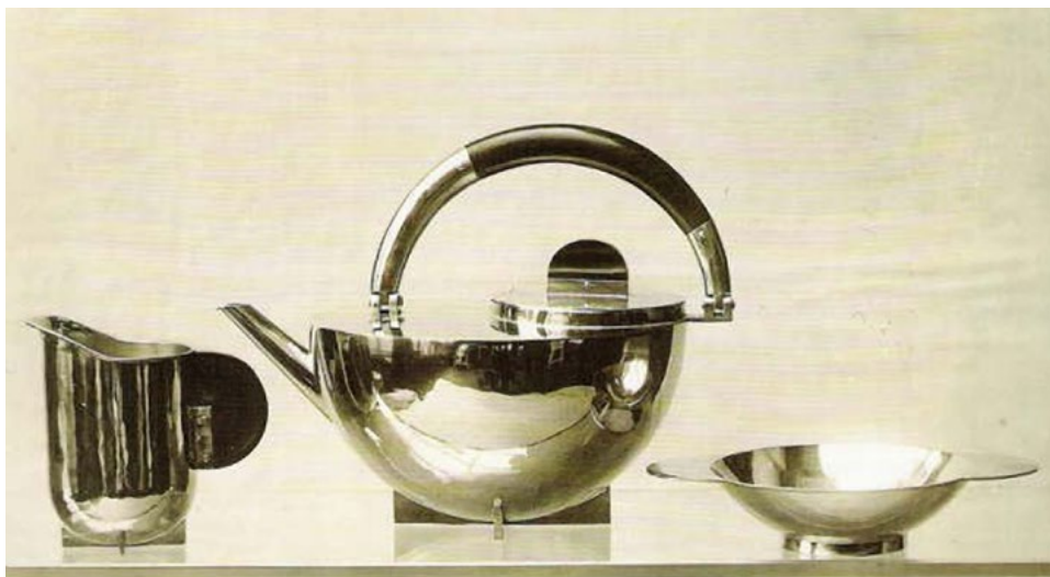
Lucia Moholy / Fotografie doplňků a designu z let 1925–1926

poprvé vystavila své snímky na mezinárodních výstavách Film und Foto ve Stuttgartu (1929) a Das Lichtbild v Mnichově (1930). V Berlíně se pár rozešel. Lucia byla ateistka, ale jelikož byla židovského původu a také se angažovala v levicovém hnutí v Německu, po převzetí moci nacisty v Německu z obavy před persekcí v roce 1933 narychlo odjela za rodinou do Prahy. V Berlíně u svého manžela nechala všechny skleněné negativy (cca 300) a tyto její snímky byly v minulosti často připisovány jiným autorům. Z Prahy pak odjela přes Vídeň do Paříže, kde také fotografovala. V roce 1934 přicestovala do Londýna. V tomto roce se úředně rozvedla a zároveň se oficiálně stala občankou Československa. Příjmení Moholy si ponechala i po rozvodu. V Lon-