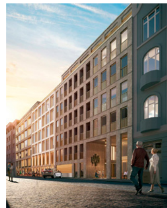
Vizualizace Petrská 18 – 22

Na místě několika zbořených klasicistních domů byla podle návrhu architekta Františka Šmolíka v letech 1973–1979 postavena prosklená budova automatické telefonní ústředny (ATÚ Těšnov). Od uvedení do provozu v roce 1981 vlivem pokroku v technice ústředna postupně ztrácela původní význam. Od roku 2017 došlo k několika změnám vlastníka nemovitosti a rovněž k vypracování několika projektů novostavby na tomto místě. Všechny projekty počítaly s likvidací stávající uliční budovy. Plánem je i otevření vnitrobloku pro veřejnost a propojení do ulice Biskupské pro pěší. Poslední majitel objektu Petrská Invest s.r.o. plánuje postavit do roku 2026 v ulici Petrské jakýsi trojdům s cca 100 byty a administrativními prostorami, podle návrhu arch. Miroslava Hrušovského z bratislavského studia Pantograph. Projekt rovněž představuje stavební úpravy pro stávající zástavbu ve vnitrobloku.