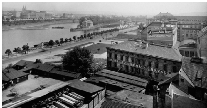
Foto z roku 1937 – Pohled na Švehlovo nábřeží, dnes ulice Lannova a L. Svobody. Přízemní dřevěné budovy vlevo dole jsou původní skautské klubovny a objekty vedle vpravo byly postaveny na místě mlýna čp. 1528. Nápis na domě čp. 1373 „Dietz a spol. Chrysler“ patří tehdejší prodejně automobilů. V pozadí nedávno postavená Nemocenská pojišťovna na štítu s reklamou na Klimentské lázně.

Ve východním sousedství Poštovního muzea je vnitroblok, pro který existuje záměr vybudování novostavby. Tento soukromý pozemek se nachází na místě původního Dietzova resp. Pickova mlýna čp. 1528 zbořeného v roce 1916.