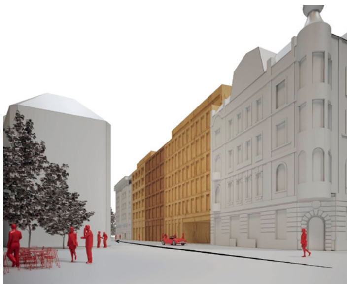
Vizualizace modelu zasazení trojdomu v Petrské 18 – 22