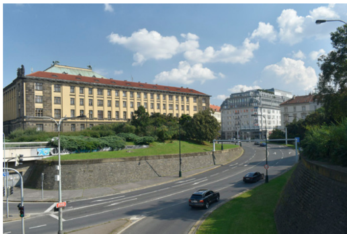
Pohled do ulice Holbova