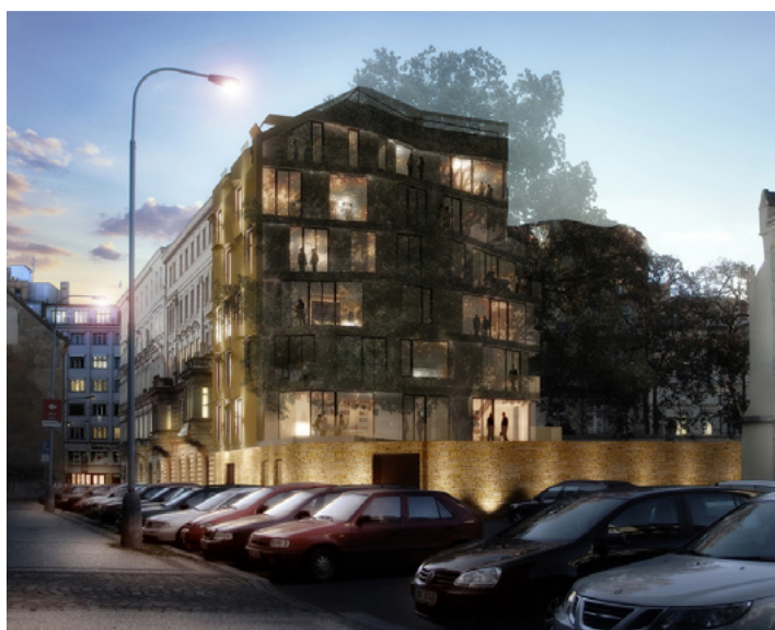
Vizualizace (AI Design) plánované novostavby Klimentská / Nové Mlýny