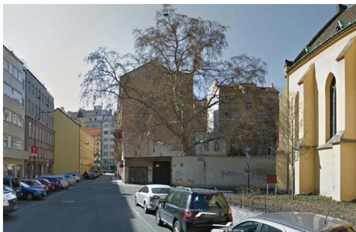
Současný stav nároží ulic Klimentská / Nové Mlýny

podlažím. Podstatná část parcely podle všech dostupných zdrojů nikdy nebyla zastavěna a byla zde zahrada, jejímž reliktem je stávající památný strom platan. Ten by stavba ohrozila a stavbou by byla dotčena i zahrada mateřské školy navazující na severu. Nyní probíhá odvolací řízení.