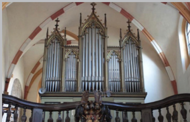
L. P. 1889 — L. P. 2019