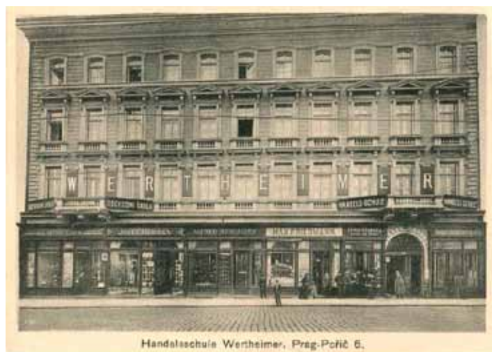
Handelschule Wertheimer, Prag-Poříčí 6.