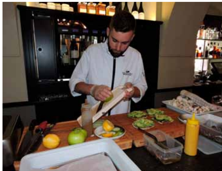
Příprava dortu ze sardinek s avokádem

měníme kompletně jídelní lístek a zákazníkům se snažíme dávat stále něco nového.“